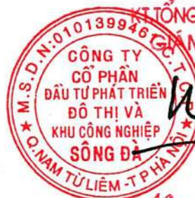
Trần Việt Dũng